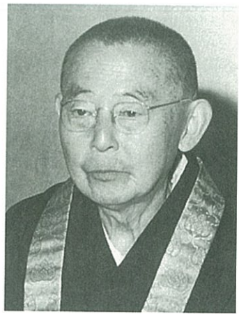
総裁 東伏見 慈洽