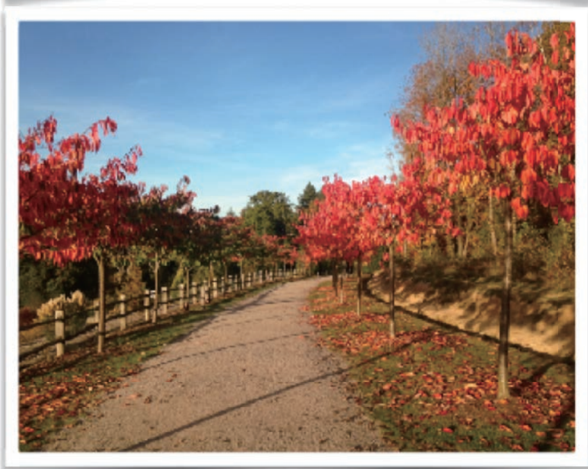
紅葉が見事な一般社団法人大日本武徳会・クワハラプロムナードの景観