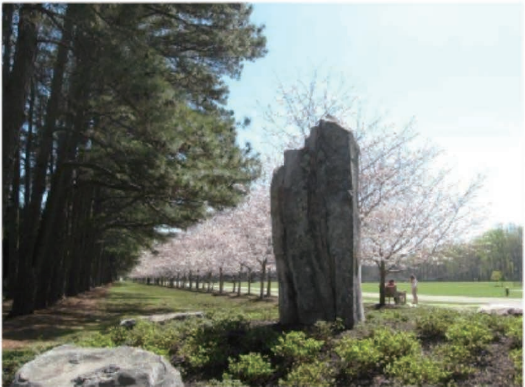
一般社団法人大日本武徳会桜並木・クワハラプロムナード