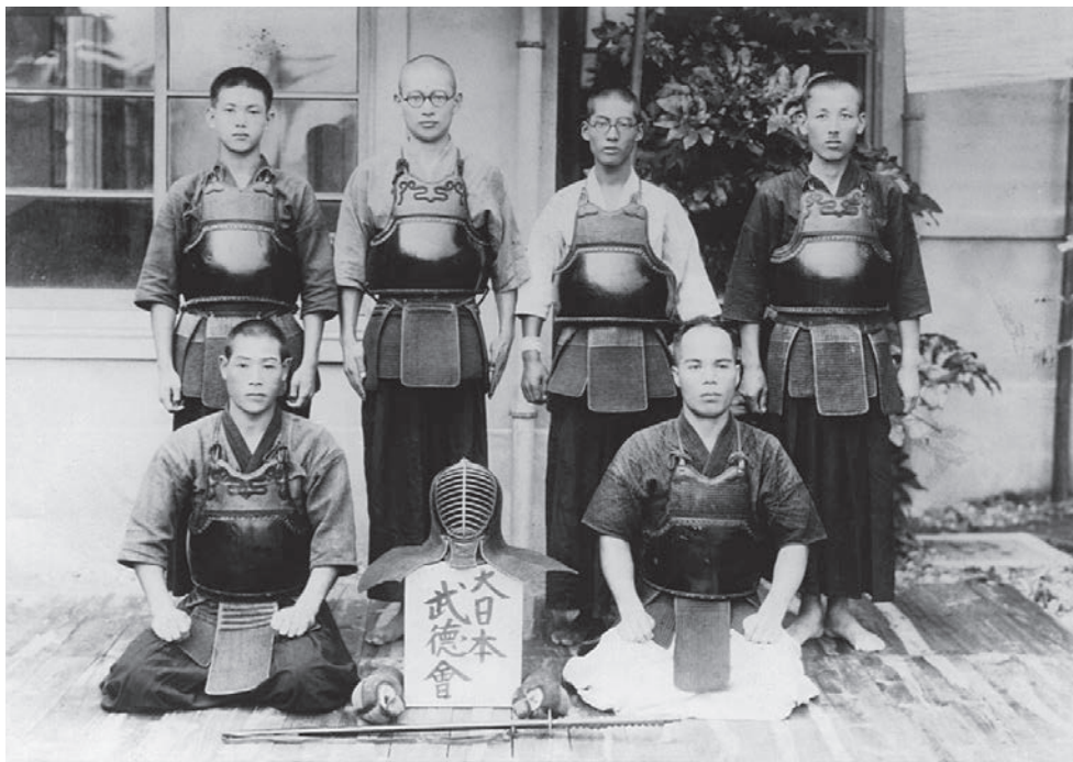
昭和18年9月 河内長野武徳会 指導者一同 大日本武徳会大阪府支部河内長野支所結成以来剣道指導補として協力された方々が昇段試験に合格した記念写真 思い出の一枚

最後はクリスチャンとして全うしたく、その瞬間まで「武士 もののふ の心」を失わないようにしたいと願っています